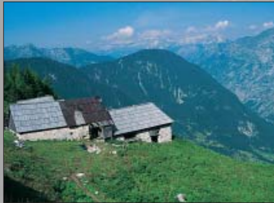
Alm Za skalo

Trenta-Museum: Ethnologisches Kulturerbe, kulturelle und historische Überlieferung des Trentatals Rekonstruktion eines Hauses im Trentatal (Wohnkultur) und einer Schafalm