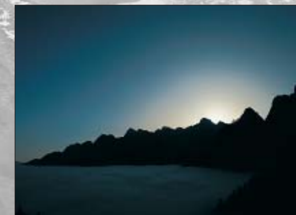
Bergkulisse des Nationalparks Triglav bei Sonnenaufgang

Das Trenta-Haus ist für Sie bestimmt. Hier präsentieren sich die Besonderheiten der Natur des einzigen Nationalparks in Slowenien und das reiche ethnologische Kulturerbe des Trenta- und des Sočatal. Unser Wunsch ist es, daß Freunde, Befürworter und Kenner des Nationalparks gerne hierher kommen und sich wie zu Hause fühlen.