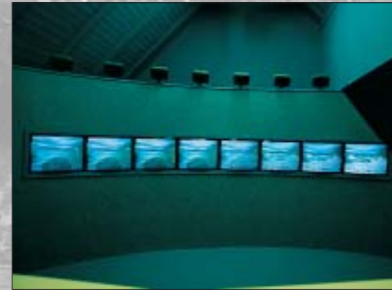
Videoinstallation Geheimnisse der Soča von Andrej Zdravčič